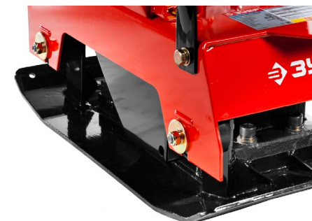
Форма плиты позволяет машине не зарываться и не тонуть в мягких грунтах