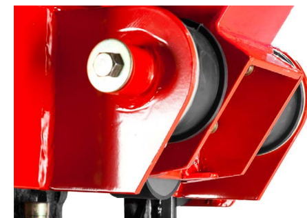
Демпфирующие проставки рукоятки для защиты оператора от вибраций