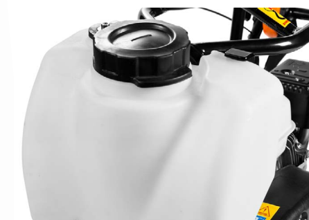
Наличие системы орошения – обязательное условие при уплотнении асфальтобетонных смесей