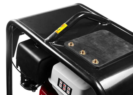
Дополнительная силовая рама защищает двигатель при транспортировке и погрузке