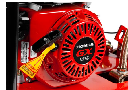
Надежный бензиновый двигатель Honda GX160 мощностью 5.5 л.с.