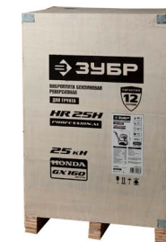
Для удобства погрузки предусмотрена деревянная упаковка с вмонтированной паллетой.