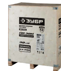
Для удобства погрузки предусмотрена деревянная упаковка с вмонтированной паллетой.