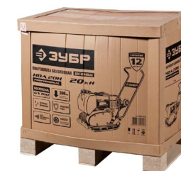
Надежная и удобная упаковка для погрузки и транспортировки