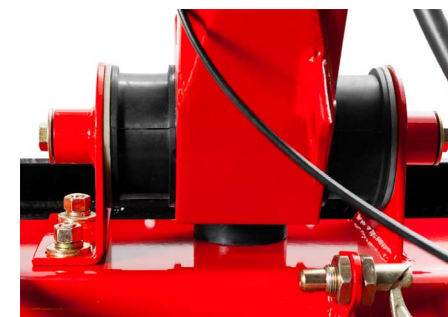
Демпфирующие проставки рукоятки для защиты оператора от вибраций