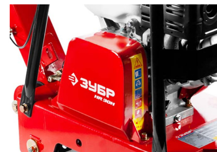
Защитный кожух ремня позволяет надежно защитить оператора от опасности контакта, а сам ремень – от поврежденной камнями и проч.