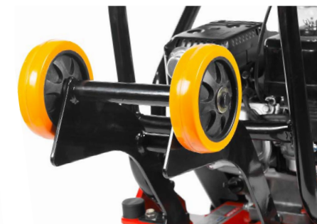
Транспортные колеса значительно упрощают перемещение устройства