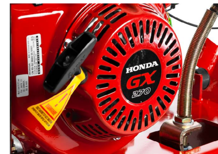
Надежный бензиновый двигатель Honda GX270 мощностью 9 л.с.