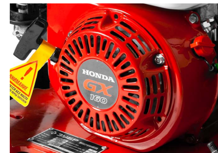
Надежный бензиновый двигатель Honda GX160 мощностью 5.5 л.с.