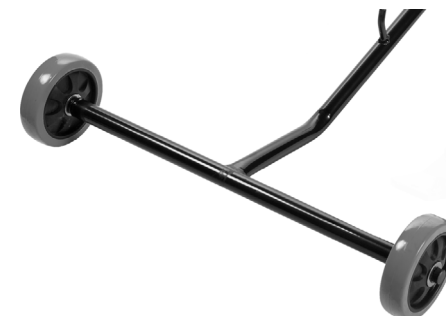
Транспортные колеса значительно упрощают перемещение устройства