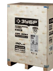
Для удобства погрузки предусмотрена деревянная упаковка с вмонтированной паллетой.